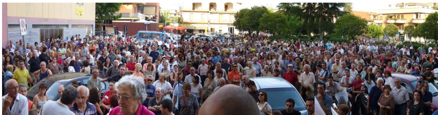
Partecipazione dei Cittadini all'Assemblea Pubblica del 19 giugno 2007 a Setteville