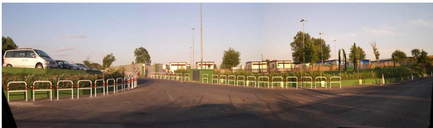
Veduta frontale del Campo Nomadi di Via di Salone (Luglio 2007)